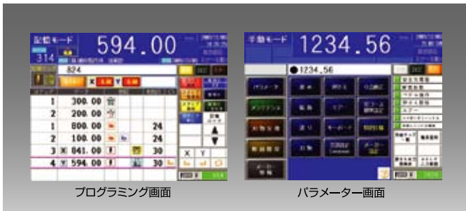
プログラミング画面

10.4インチTFTカラー液晶ディスプレイを採用。タッチパネル方式により、ジョブプログラミングをはじめ、クランプ圧力や送り移動速度等のパラメーター設定、主要な操作が簡単におこなえます。