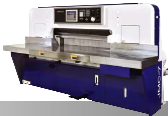
Paper Cutting Machine JMC-7