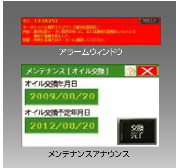
アラームウィンドウ

オイル交換や給油等、メンテナンス時期をお知らせします。断裁機に異常がある場合は、自己診断をおこないアラームを表示します。